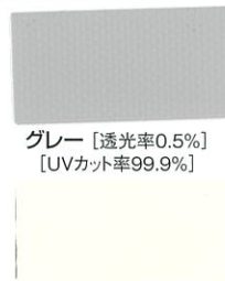
グレー [透光率0.5%] [UVカット率99.9%]