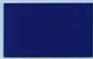
ダークパープル 透光率:0%