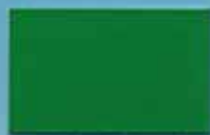
フォレストグリーン 透光率:0.2%