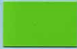
ライトグリーン 透光率:1.6%