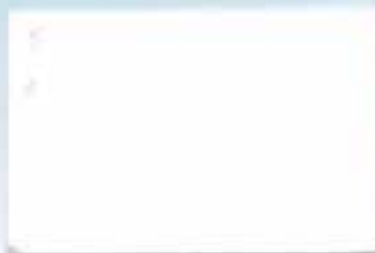
クリアホワイト 透光率:12.9%