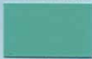
エメラルドグリーン 透光率:0.2%