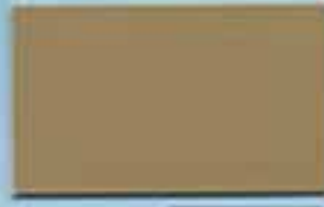
ライトブラウン 透光率:0.1%