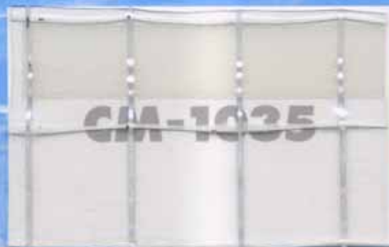
CM-1035 / 厚さ0.35mm 防災・耐候・耐寒