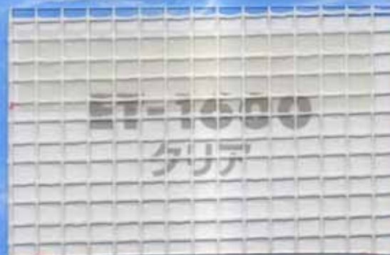
ET-1600クリア / 厚さ0.80mm 防災