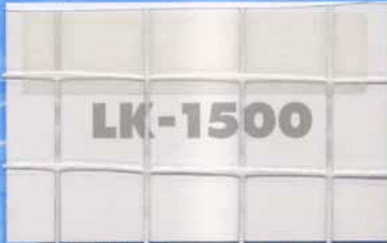
LK-1500 / 厚さ0.25mm 防災