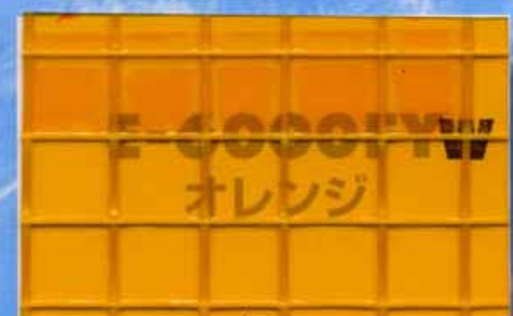
E-6000FYオレンジ / 厚さ0.55mm 防虫・防災