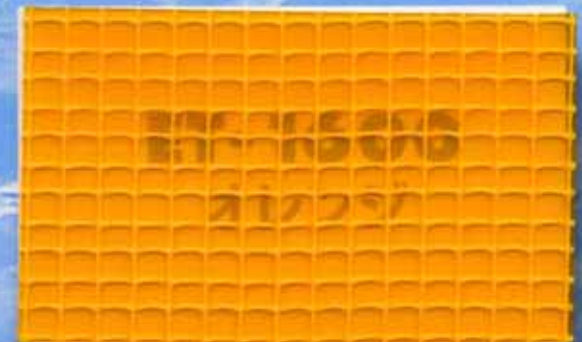
ET-1600オレンジ / 厚さ0.80mm 防虫・防災