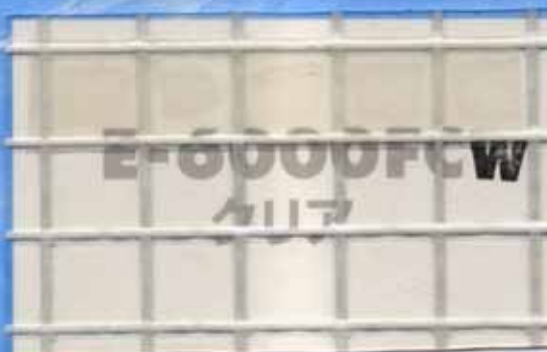
E-6000FCクリア / 厚さ0.55mm 防災