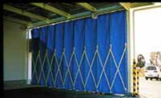
防風カーテン(内側)