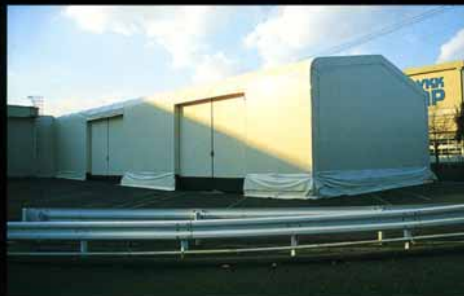
金型置場 ●W13×L50×H5 (m) ●側面出入口はオプション