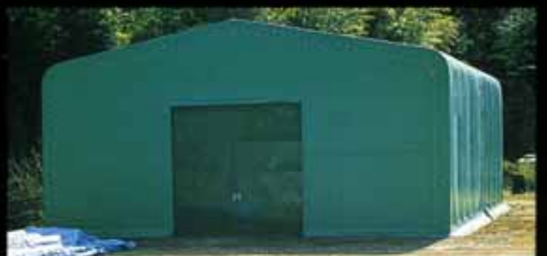
金属材料倉庫 ●W15×L15×H4 (m) ●出入口はオプション