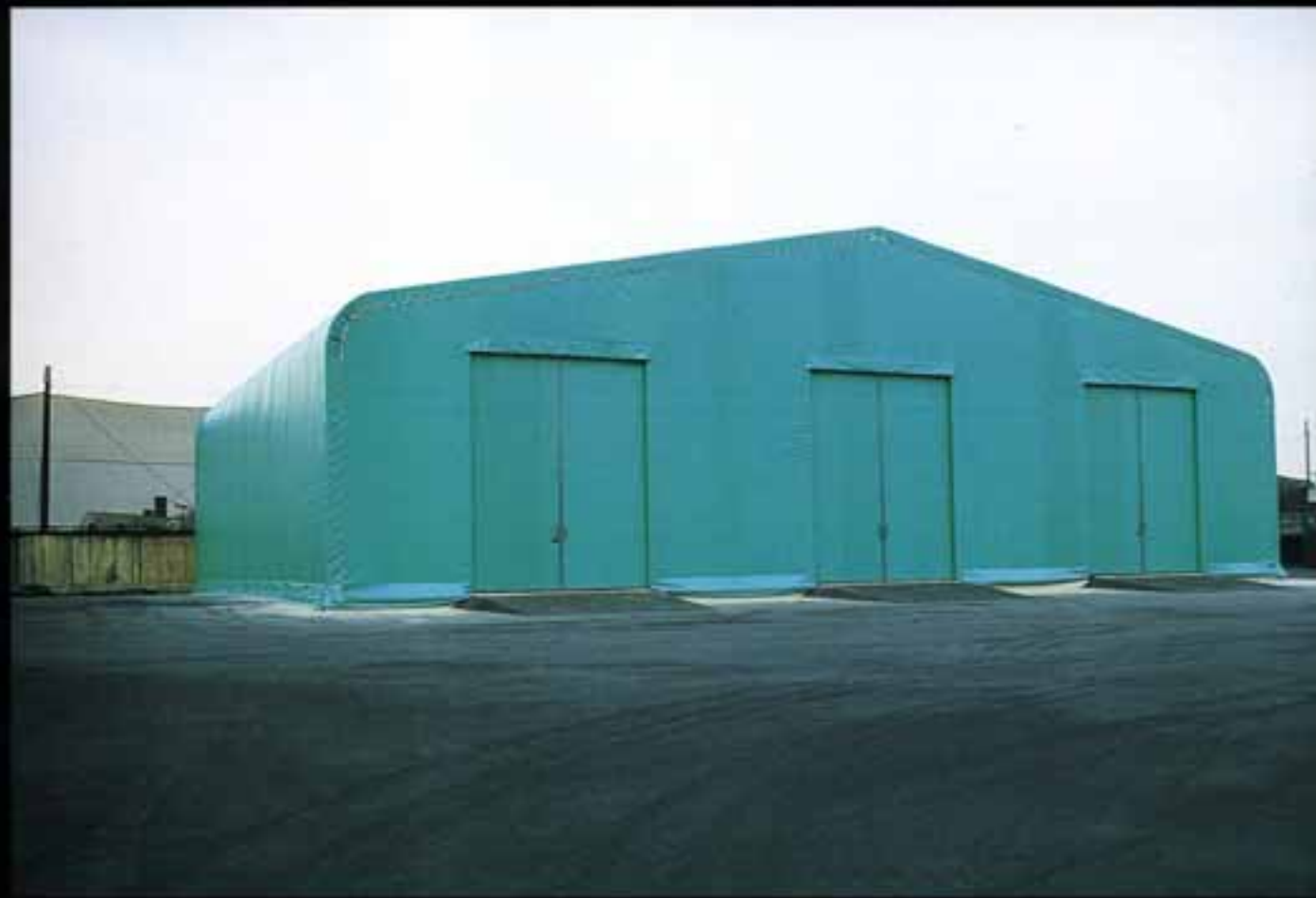
輸入品原料倉庫 ●W20×L25×H5 (m) ●出入口はオプション

エルコンハウス<MTK型>は、建設省の認定(東住指発第72号)の基準に適合し、物流業界、製造業界、販売業界など、数多くの産業分野で採用され活躍しています。また、エルコンハウスは、苛酷な条件下でも長期間使用できる耐久性を備えており、一般建築に比べ短期間に設置・撤去できるため、すばやく市場動向に対応でき、低コストで経済的にも大きなメリットがあります。