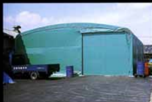
エルコンハウス仮設式タイプ ●W10×L15×H4 (m)