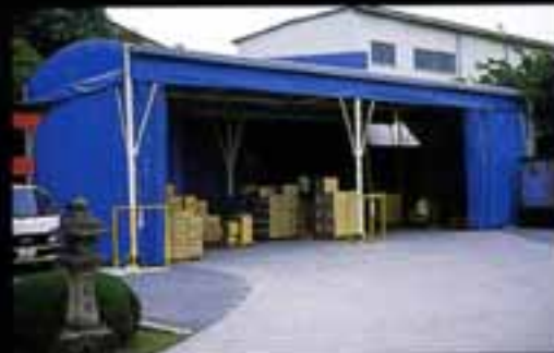
商品保管スペース ●W6×L16×H4.5(m)