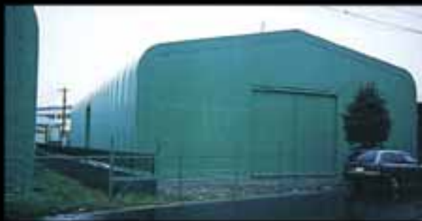
食品原料倉庫 ●W15×L30×H5 (m) ●出入口はオプション