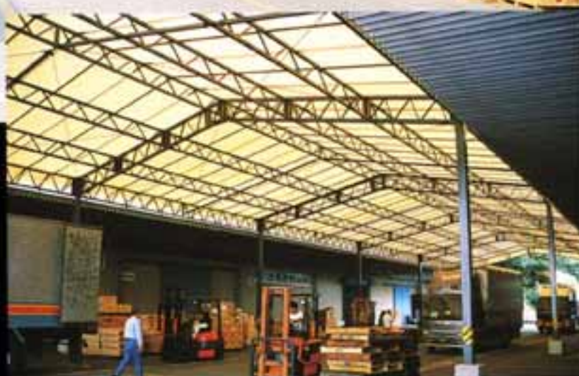
倉庫兼荷捌場内部