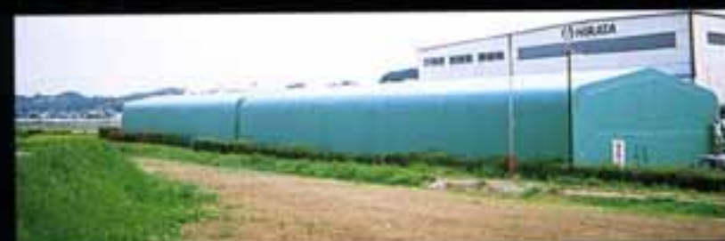
部品倉庫 ●W12×L39×H5 (m) 2棟