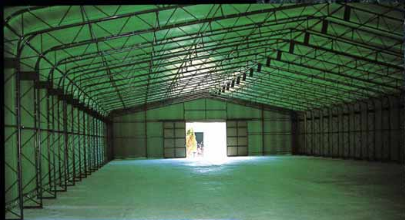
エルコンハウス内蔵 ●W18×L18×H4 (m)