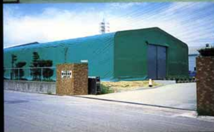
陶器製品倉庫 ●W14×L24×H4 (m) ●出入口はオプション