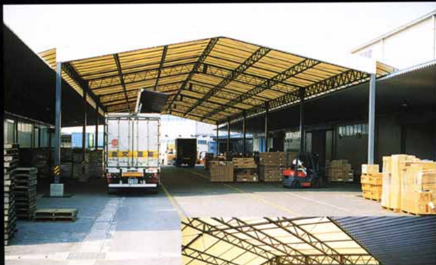
倉庫兼荷捌場 ●W14×L46×H5 (m)

工場や物流の荷捌場として最適な環境づくりに自由な設計でお応えします。雨天時の屋外作業・一時保管のスペースとして、荷役作業の効率アップと物流の円滑化に大きく貢献します。