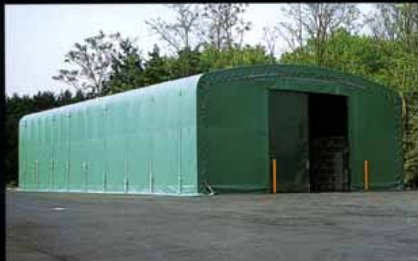
エルコンハウス仮設式タイプ ●W10×L20×H4 (m)

本体がプレハブ構造のため、短期間での設営が可能で、撤去、移設もスピーディ、初期投資および維持費用とも低コストで、経済的にも大きなメリットがあります。