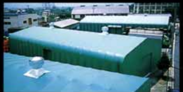
食品原料倉庫 ●W15×L30×H5 (m) ●換気扇はオプション