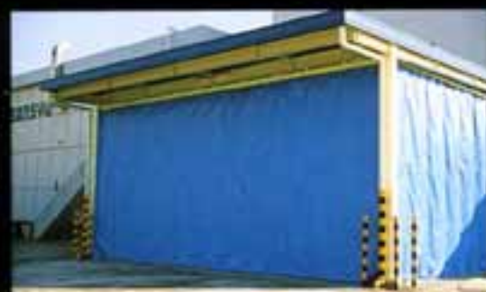
防風カーテン(外側)