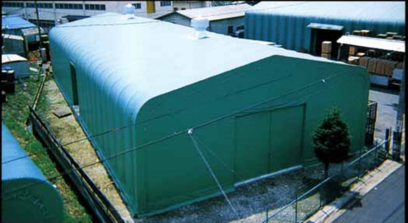
食品原料倉庫 ●W15×L30×H5 (m) ●換気扇はオプション

エルコンハウス<HS型>は、降雪地方でも使用できるよう積雪や風雨に耐える高強度設計です。